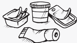
ኩባያ ፕላስቲክ፡ ቱቦ ፕላስቲክ፡ ብፕላስቲክ እተሰርሐ መዕሽኒ