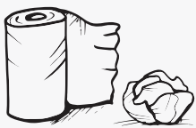
ናይ መንቀጺ ወረቆት፡ ናፕኪን