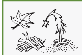
ጉዳዮች ጀርዲን፡ አም ልደት