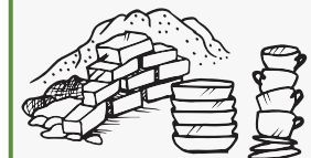
መንደቕ፡ እምነ፡ ሓመድ፡ ካሻሽት-ሩስ፡ ካይላ፡ ሰራሚክ፡