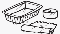
ብአሉ-ሙንዮም እተሰርሐ መዕሽኒ፡ መትሓዚ ሽምዓ