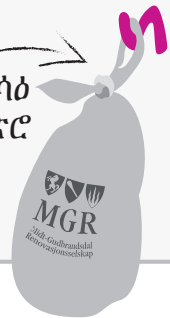
ክልተ ሳዕ ክትቋጽሮ አለዎካ