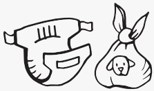
ጨርቂ ሽንገራ ቛልዓ፡ ናይ ከልቢ ፕላስቲክ፡ ናይ ድሙ ሑጻ