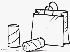
ብካርቶን እተሰርሐ መትሓዚ፡ ከረጸት ወረቆት