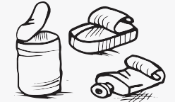
ካብ ሓጺን እተሰርሐ ሳጺናትን ቱቦታትን