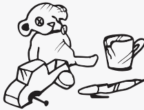
እተበላሸወ አቕሓ (ብዙሕ ዘይኮነ)