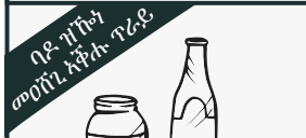
ፕሮሙዝ፡ ናይ መስተ ጠራሙዝ፡ ካብ ሓጺን እተሰርሐ መኻደኒ/ቡሽ