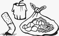
ሓሙኽሽቲ/ፊሓም (ዝጠፍአ)፡ ሽምዓ፡ መዓኮር ሽጋራ