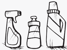
ናይ ፕላስቲክ ፕሮሙዝ