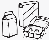
ብካርቶን እተሰርሐ መዕሽኒ