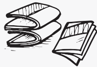
ጋዜጣታት፡ መጽሔታት፡ ፊክላማት