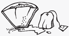
ናይ ቡን መጻሪይ፡ ናይ ሻሂ ከረጸት